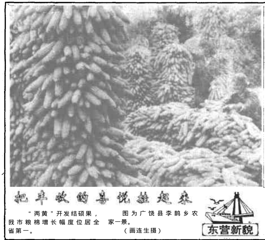
把丰收的喜悦挂起来

环境保护是我国的一项基本国策，必须常抓不懈，一刻也不能放松。要把环保工作列入到国民经济和社会发展的总体规划中，提到与发展生产力、抓计划生育相同的高度认真对待。要积极实施政府首长环境保护目标管理责任制，增强各级领导抓好环保工作的责任感和紧迫感。要树立环保工作的权威性，积极支持环保部门依法监督管理环境保护，动员全社会的力量重视和支持环保工作。要加强环保机构和工作队伍建设。市委、市政府确定，在机构改革中，县区要继续保留环保局，使他们更好地做好环保监督管理工作，以促进环保工作和经济建设的同步、更快发展。